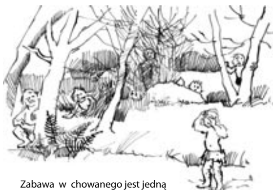
Zabawa w chowanego jest jedną z najstarszych zabaw ludzkości

Zdaniem Jana Huizingi, zabawa to aktywność, w którą wpisana jest chęć do życia i zachowania oparte na normach. Według niego, u źródeł wszelkich poczynań człowieka, także u podstaw szeroko rozumianej kultury, leży zabawa. Paradoksalnie zabawa – gra, współzawodnictwo – leżą u podstaw zarówno wojen, jak i nauki, sztuki i filozofii. Podczas zabawy mamy do czynienia z doświadczeniem duchowym (którego nie należy utożsamiać z przeżyciem religijnym). To oznacza pewien „nadmiar”, którego przejawem jest zabawa. W przypadku człowieka pracującego – homo faber i rozumnego – homo sapiens nadmiar ten oznacza, że jesteśmy więcej niż rozumni. Zabawa jest też czymś więcej niż tylko rozumnym zachowaniem 26 .