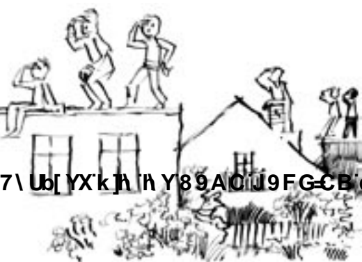
Wieś tematyczna poszerza horyzonty

Zaangażowanie się w tworzenie wioski tematycznej uczy nowych postaw i wzmacnia poczucie własnej wartości. Ludzie zaczynają wychodzić z domu, zaczynają ze sobą rozmawiać, odkrywają swoje zdolności. Stają się bardziej atrakcyjni dla siebie wzajemnie i dla innych. Nabierają odwagi, aby zaistnieć nie tylko w swojej wiosce, ale i poza nią. Nabierają wiary w swoje siły i umiejętności odgrywania różnych ról społecznych. Odzyskują umiejętność bawienia się, nawiązują inny kontakt z ludźmi z zewnątrz. Budzi się w nich gotowość do uczenia się i odwaga, by podejmować nowe wyzwania. Wiele osób uczestniczących w tworzeniu wiosek tematycznych w ramach działań Partnerstwa „Razem” podkreślało znamieny fakt: „Odważyłam się mówić, przedtem bałam się odezwać, nie tylko przy obcych, ale nawet w domu”. Mówienie ma związek z odgrywaniem ról, z byciem w ogóle. Kiedy mówię, przestaję być statystą, biernym odbiorcą zdarzeń, staję się aktorem dosłownie i w przenośni – zaczynam naprawdę żyć.