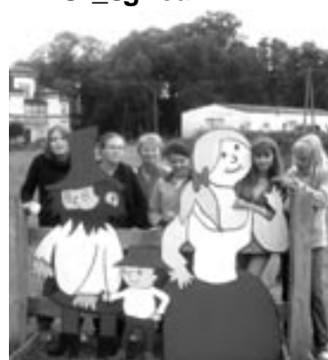
Podgórkki Wioska Bajki i Rowerów