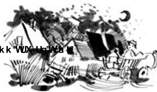
Ostatni gasi światło

Gospodarka jest jak rozmowa: żeby w niej zaistnieć, trzeba mieć swoją ciekawą opowieść, dobry temat.