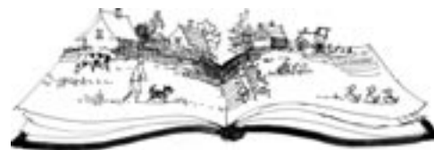
Odczytać wieś na nowo

W pracy tej przedstawiono roboczą definicję wsi tematycznej 3 . Wieś tematyczna to wieś, której rozwój podporządkowany jest wiodącej idei, tematowi. Wieś dzięki temu staje się wyróżnialna i jedyna w swoim rodzaju. Wieś koncentrująca się na określonym kierunku, temacie rozwoju, w porównaniu z innymi wsiami o podobnym stanie wyjściowym, rozwija się lepiej pod względem gospodarczym i społecznym. We wsi takiej wzrasta też wyraźnie poziom optymizmu. Prezentowana tu definicja stała się jednocześnie tezą, którą testowano i obroniono na podstawie badań przeprowadzonych w czterech wsiach.