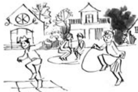
Na ulicy Celebration

Tematyczność znalazła swój perfekcyjny wymiar wraz z otwarciem w 1955 roku Disneylandu. Nie mogąc się porozumieć z architektami, Walt Disney zatrudnił do pracy przy projektowaniu swego pierwszego parku rozrywki scenografów i reżyserów z Hollywood. Oni potrafili zrozumieć jego ideę przeniesienia opowieści w życie. Dopełnieniem marzenia Disneya, zrealizowanym już po jego śmierci, było zbudowanie na Florydzie idealnego miasta Celebration. W listopadzie 1996 roku sprowadziło się do niego pierwszych 350 mieszkańców. Obecnie miasto liczy 5000 obywateli, a planowane jest na 20 tysięcy. Celebration jest spełnieniem marzeń o dobrym, cukierkowym, amerykańskim miasteczku, jak z filmów Disneya: „Było kiedyś takie miejsce, gdzie sąsiedzi pozdrawiali sąsiadów o cichym letnim zmierzchu... Jest takie miejsce, w którym powrócisz do czasów niewinności... Miejsce ulubionych cukierków z dzieciństwa, sekretnych kryjówek i gry w klasy na chodnikach” 15 .