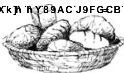
„Chleba naszego powszedniego”

Przykładem ekomuzeum jest Muzeum Chleba w miejscowości Seia (Portugalia). To prywatny kompleks muzealny, w którym zachowano tradycje, historię i sztukę wypieku chleba. W Muzeum Chleba można zwiedzić stałe ekspozycje poświęcone takim zagadnieniom, jak np.: cykl wypieku chleba; chleb w kulturze, polityce i religii; sztuka wypieku chleba; chleb (praca i narzędzia); dzieła sztuki inspirowane chlebem. Jest tu też „Sala zabawy, nauki i fantazji”, w której można prowadzić doświadczenia związane z wypiekiem chleba. Muzeum Chleba sponsoruje wydawnictwa, których tematyka wiąże się z chlebem, uprawą ziemi i historią żywności w Portugalii, np. książkę Chlebowe słowa , spis około sześciuset portugalskich powiedzeń wiążących się z chlebem, wraz z komentarzami.