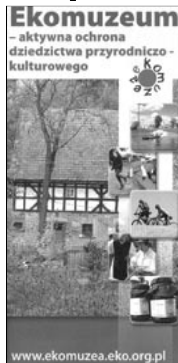
Folder promujący ekomuzea na Dolnym Śląsku

Ekomuzeum to muzeum bez murów. Działa jako sieć rozproszonych w terenie obiektów (ekspонатów). Tworzą one kolekcję prezentującą przyrodę i kulturę regionu. Ekomuzea mogą działać na bazie jednego gospodarstwa – przypominają wtedy gospodarstwo tematyczne, na obszarze