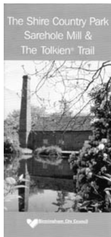
Trasa Tolkiena w Wielkiej Brytanii, którą w 2008 roku odwiedzili hobbici z Sierakowa