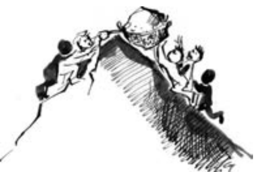
- Razem damy radę.

Pożytkiem ze sfery polityki z tworzenia wsi tematycznej jest to, że mieszkańcy wsi uzyskują większą świadomość swej wartości. Sołtys takiej wsi na posiedzeniu Rady Gminy może z większym przekonaniem i wiarą we własne siły zabierać głos. Taka wieś może na nowo zaistnieć w polityce. Społeczność wiejska jest bardziej świadoma tego, co się dzieje w świecie i może bardziej świadomie wybierać, nie idąc już tak łatwo na lep taniego populizmu.