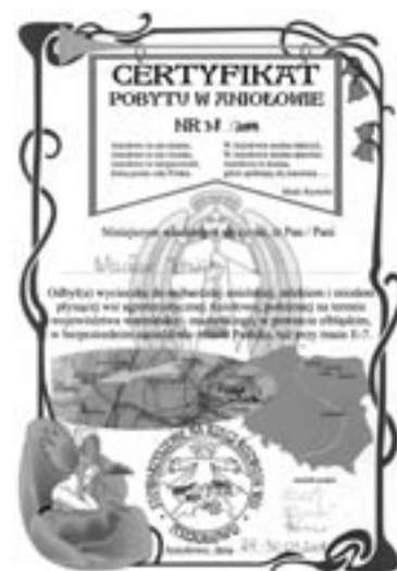
Certyfikat pobytu w Aniolowie

Tworzenie wioski tematycznej to okazja do kontaktów, spotkań, rozmów, znajomości, których by bez tego nie było. Kreowanie gry terenowej dla pięciu wsi tematycznych, której jednym z elementów będą pola do disc golfa, dało powód do odwiedzenia takiego pola w Anglii i nawiązania współpracy z mistrzem Wielkiej Brytanii w tej dyscyplinie sportu. Tworzenie labiryntów wierzbowych w Paprotach przyczyniło się do zorganizowania tam plenerów wikliniarskich i nawiązania współpracy z artystami tworzącymi formy przestrzenne z żywej wierzby. Wieś Iwęcino zajmująca się tematyką końca świata zaczyna budzić zainteresowanie wśród badaczy tego zagadnienia. Mieszkańcy wioski tematycznej mają też więcej powodów, żeby korzystać z Internetu i komunikować się w sieci, bo mają ciekawe tematy, którymi mogą się dzielić i wiele powodów do szukania informacji przydatnych w tworzeniu wioski i jej oferty, np. mieszkaniac Podgórek odgrywający rolę Rumcajsa, korzysta z Internetu, by wzbogacić swój repertuar zabaw i łamigłówek.