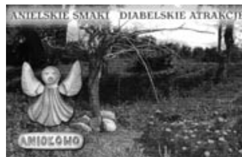
Pocztówka z Aniolowa

To właśnie poczucie bycia dostrzeganym, znanym, cenionym zachęca do pracy nad sobą i przy zakładaniu wioski tematycznej. Kiedy wieś staje się ważna, staje się jakaś, to również jej mieszkańcy przestają być anonimowi i mają sposobność, żeby podróżować, poznawać innych, zapraszać do siebie. Jeden z mieszkańców Sierakowa zagadnięty przez kolegę z innej wsi „Jak to jest, wy jesteście niby normalne chłopy, ale ze swoimi to bym tak nie pogadał?”, odparł: „No bo my się podciągamy.”