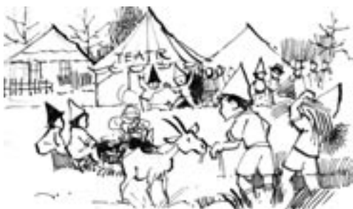
- Zaraz gramy!

Jaki może być wspólny mianownik wiosek tematycznych? W czym jest podobna austriacka Wioska Nonsensu Herrnbauergarten 30 do francuskiej Wioski Owczej Vasles 31 i polskiej Wioski Hobbitów? Wydaje się, że podobne jest w nich to, że ze swoją ofertą kierują się w stronę nowej gospodarki, proponując klientom emocje, wiedzę i możliwość tworzenia. Wspólne w takich wioskach jest też to, co można by roboczo nazwać teatralizacją, której początkiem jest nowa interpretacja wsi, związana z tematem specjalizacji. Wioska tematyczna to rodzaj przebrania, inscenizacji wsi, czasem bardziej, czasem mniej wyraźnej. Kiedy pojawia się w wiosce makowej, to od razu wiadomo, że to właśnie ta wioska. Wjeżdżających do Krzywogońca – wioski grzybowej – wita tablica z nazwą wsi w kształcie borowika 32 . Niekiedy przebijają się również mieszkańcy wioski tematycznej, jak np. w Podgórkach, które stają się wioską bajki i rowerów. Teatralizacja czy zabawa służą w zasadzie dwóm celom. Po pierwsze, aby choć na chwilę uwolnić się z okowów norm społecznych i dać upust prawdziwej naturze – tak działo się podczas obrzędów dionizyjskich, z których narodził się teatr. Po drugie, teatr pozwala bezpiecznie (to tylko zabawa) spróbować siebie w nowej roli. Karnawał to taki czas, kiedy ludzie dają sobie przyzwolenie na przekraczanie norm. Zakładając maskę, stajemy się anonimowi, ale też stajemy się kimś innym. Zapewne dlatego maska jest elementem obecnym we wszystkich kulturach świata.