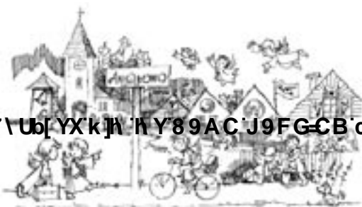
Może takie Aniołowo?